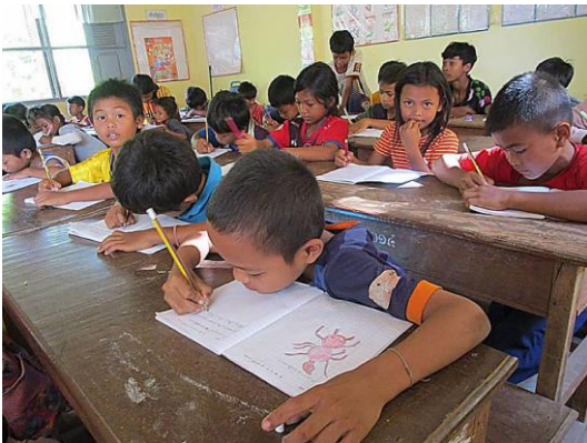
Cambodge : Apprentissage de l'anglais