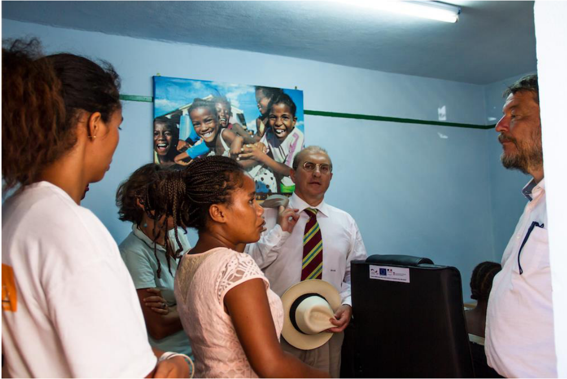
Madagascar : Un centre destiné aux enfants victimes de maltraitance