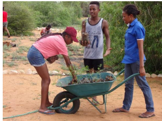
Madagascar : Des étudiants malgaches en soutien à nos projets