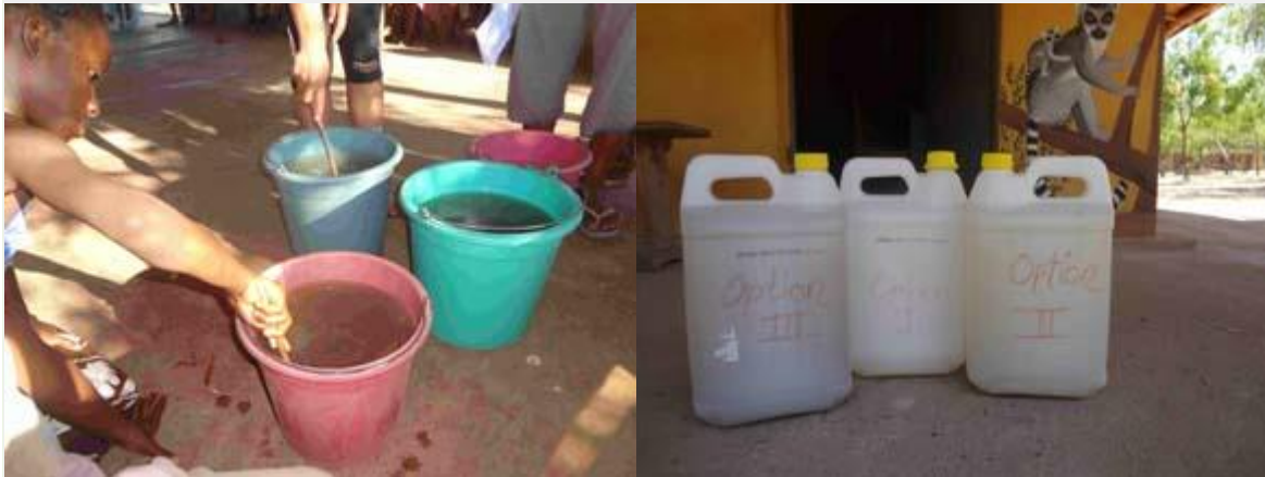
Formation de jeunes à la purification de l'eau issue de puits