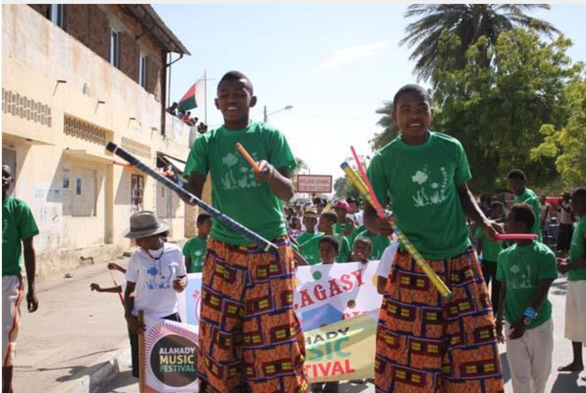
Nos jeunes artistes sur des échasses ouvrant le défilé à Tuléar

Des milliers d'enfants et de jeunes de Tuléar se sont réunis cette dernière fin de semaine pour participer au grand Alahady Music Festival organisé par les élèves en gestion culturelle du Centre d'Art et Musique de Bel Avenir à Tuléar autour du respect à l'environnement marin. La salle du Cinéma Tropic au dit centre était comblée pendant les trois jours du festival.