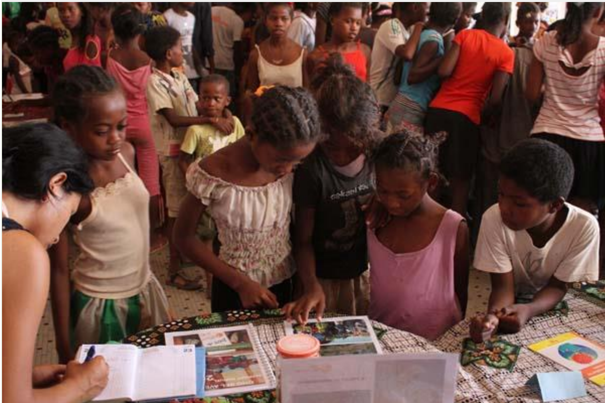
Activités sur l'Environnement Marin au sein du Cinéma Tropic