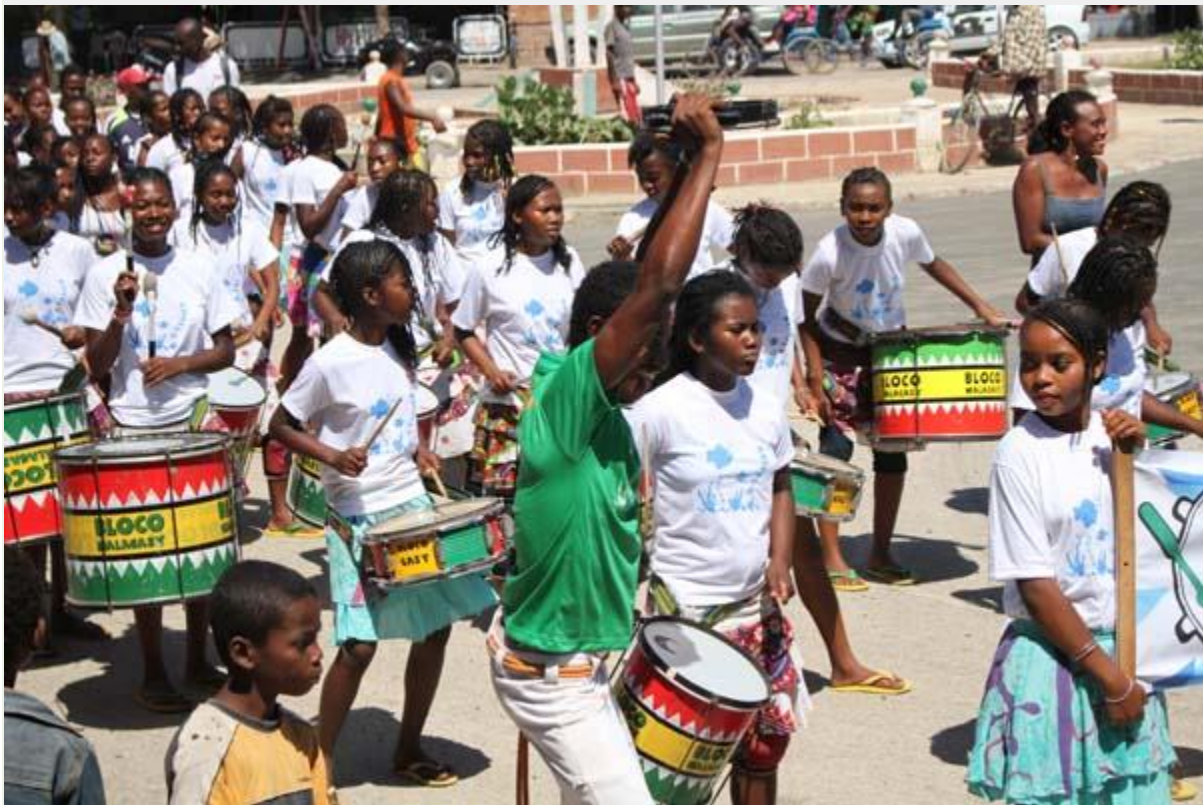
Les élèves du Centre Art et Musique - Bel Avenir lors du défilé