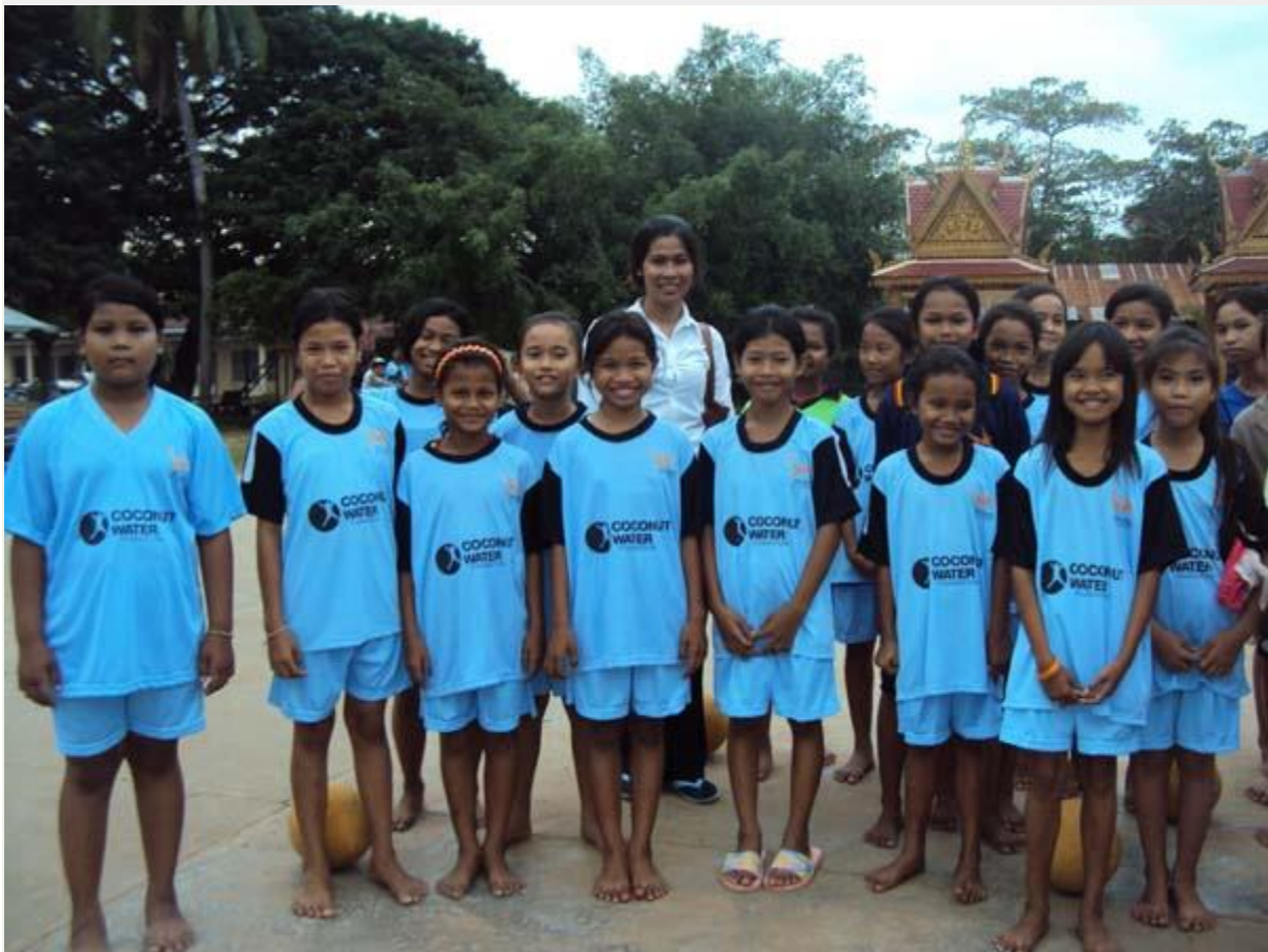
La nouvelle équipe féminine de football - Coconut Water Cambodia