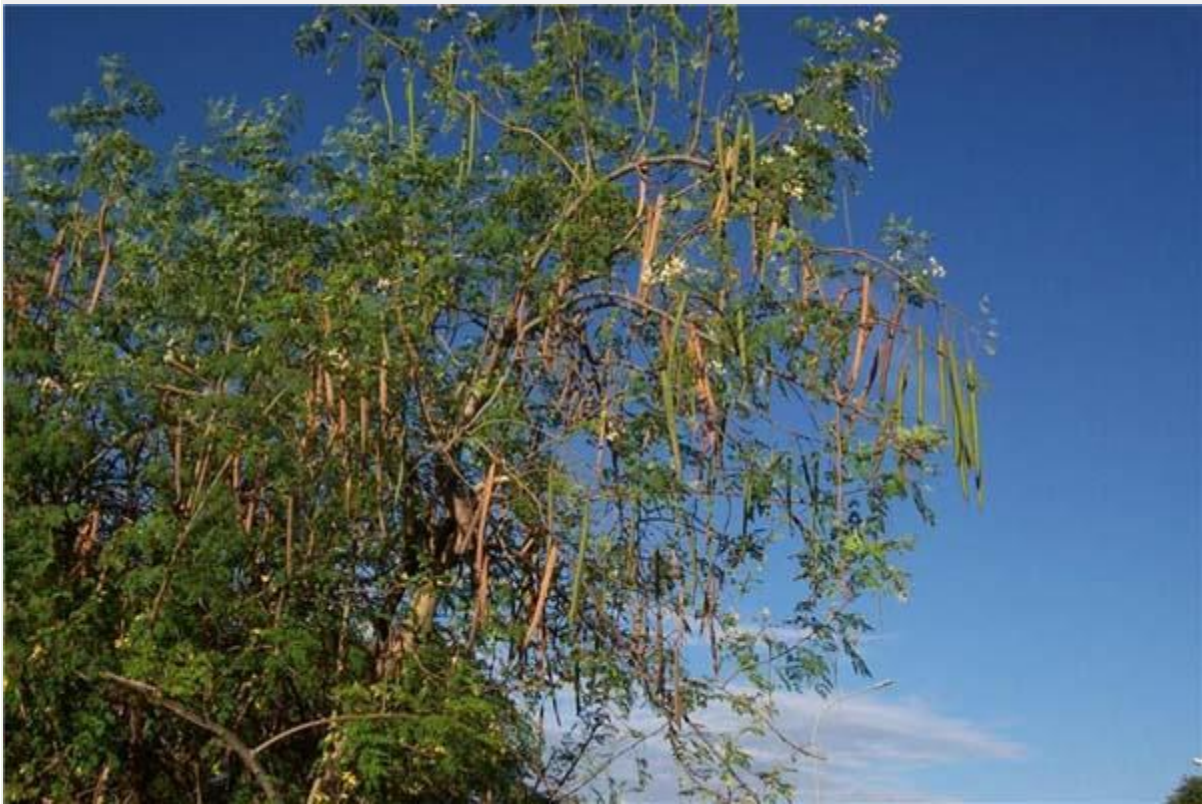
Les feuilles et les graines du Moringa Oleifera

Moringa Oleifera à Mangily (plus de 2 Ha). Le Moringa est un arbre poussant sous le climat tropical d'origine indienne et à usage multiple.